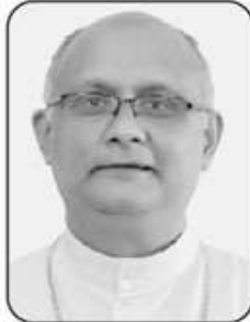
അഭി. മാർ ടോണി നീലക്കാവിൽ (ത്രൂശൂർ അതിരൂപത സഹായ മെത്രാൻ)