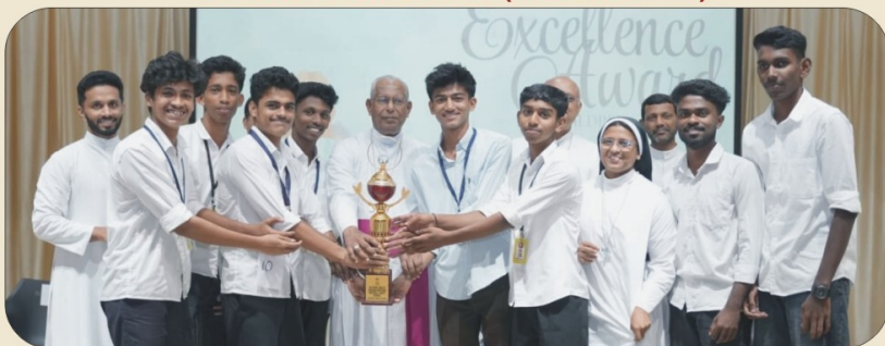
A.B.A. ARCHDHICESAN (MODEL UNIT)