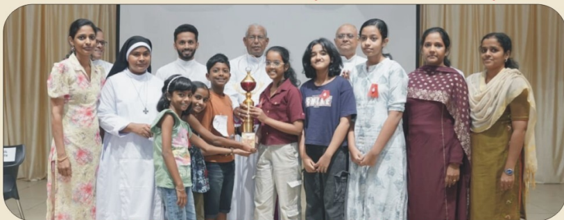
H.C ARCHDHICESAN (MODEL UNIT)