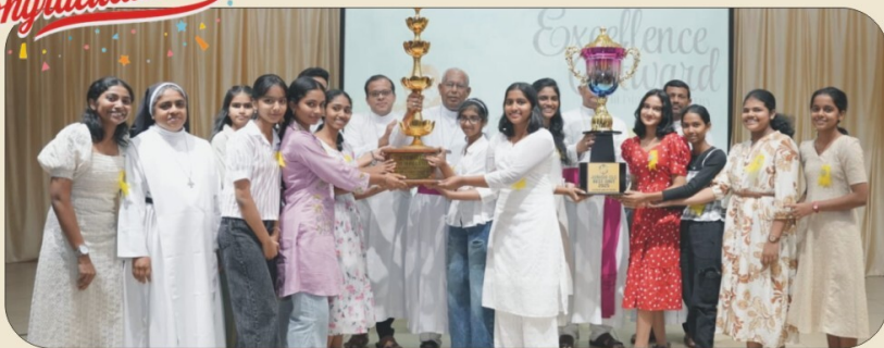
J.C.L.C. ARCHDHICESAN (BEST MODEL UNIT)