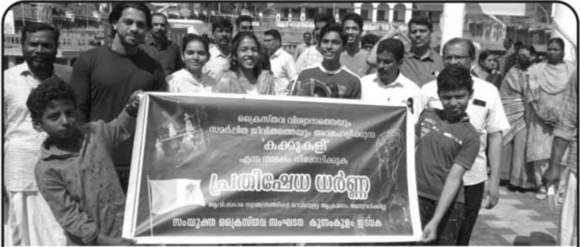
കൈസർവ സന്ന്യസ്ഥരെ അധികേഷപിച്ച് അവതരിപ്പിച്ചുകൊണ്ടിരിക്കുന്ന കക്കുകളി നാടകത്തിനെതിരെ കുന്നംകുളം സെന്റ് സെബാസ്റ്റ്യൻസ് ഇടവകയുടെ നേതൃത്വത്തിൽ നടത്തിയ പ്രതിഷേധ റാലി