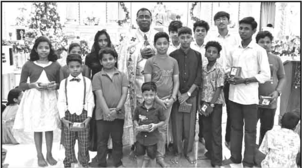
2023 ക്രിസ്തുമസിന് 25 ദിവസവും മുടങ്ങാതെ വി. കുർബാനയിൽ സംബന്ധിച്ച വിശ്വാസ പരിശീലന വിദ്യാർത്ഥികൾ വികാരിയച്ചനോടൊപ്പം