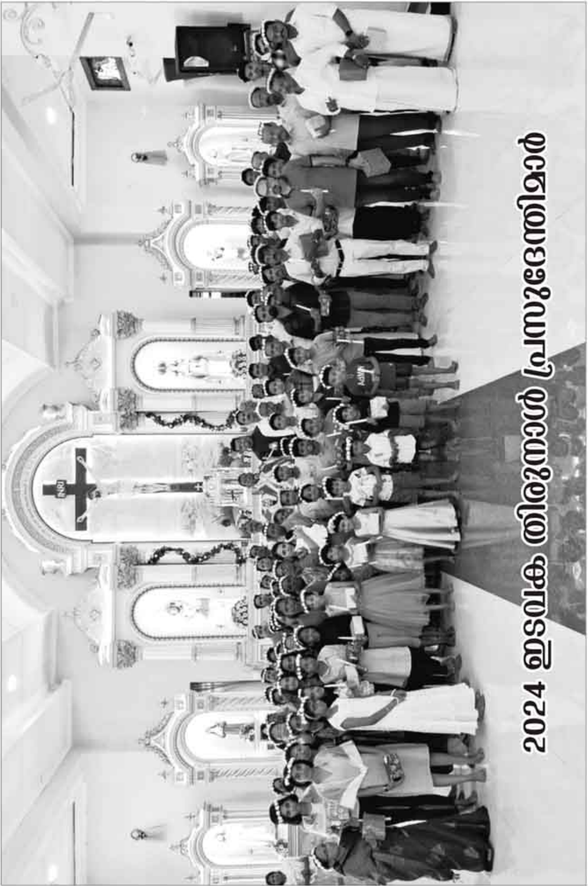
2024 ഇടവക തിരുനാൾ പ്രസുദേശ്വരിമാർ