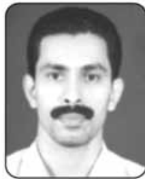
സി. എം. സാംസൺ (പ്രസക്ടർ)