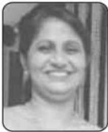
ജാൻസി ആന്റോ (ലിറ്റർജി)