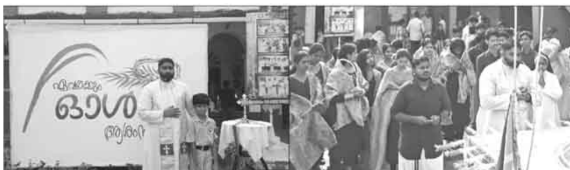
ലോക സി.എൽ.സി. ദിനം